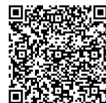
報名表單 QR CODE