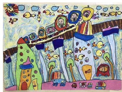
桃園區頂好幼稚園 熊妍瑄(6 歲)-「搭火車到外婆家玩」