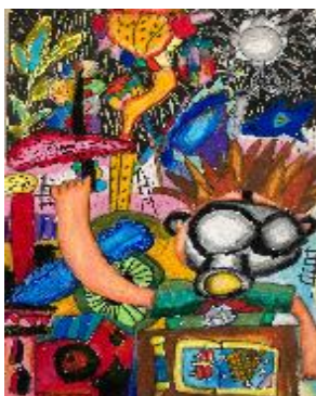
臺中市東海大學附設小學 莊凌翔(9 歲)-「有一天我做了一個夢」