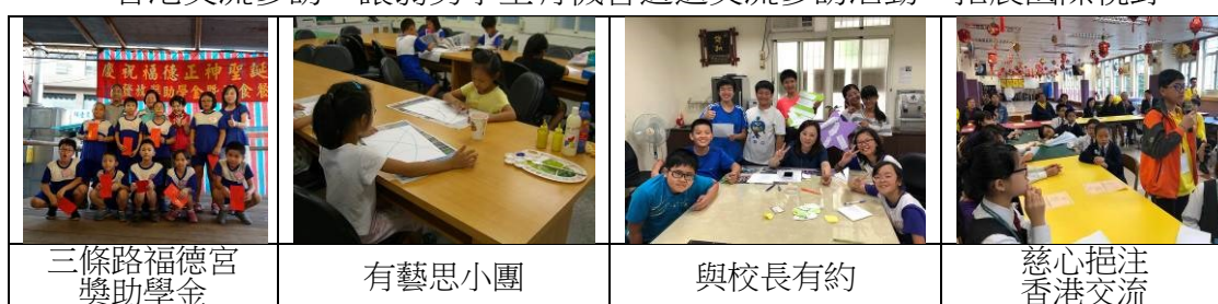
三條路福德宮 獎助學金

5.挹注獎助拓展視野： 慈心教育助學金長年提供弱勢學生班級經營費用，106 學年度更支持學校國際交流參訪之教育理念，全額贊助 2 位弱勢生至香港交流參訪，讓弱勢學生有機會透過交流參訪活動，拓展國際視野。