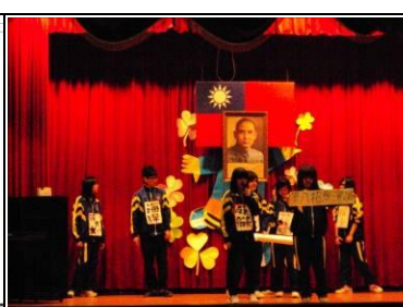
大理高中春暉宣導