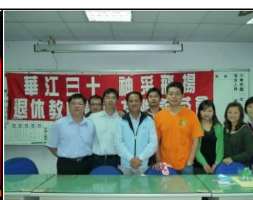
退休教師與校友會聯誼

(二) 合宜進行資源分配，提高學校辦學效能：本校積極申請教育部與教育局計畫補助並引進社會資源，從『關懷學生學習，挹注學習資源之不足；提升教師專業能力，精進教師專業成長；提升親職教養，辦理家長成長教育；爭取多元經費，營造優質學習環境』四個面向，合宜進行資源分配，讓華江國小優質成長。