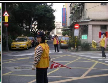
導護志工維護學童安全