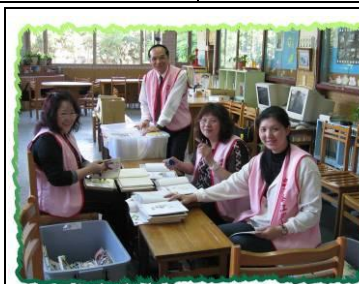
圖書志工修補舊書