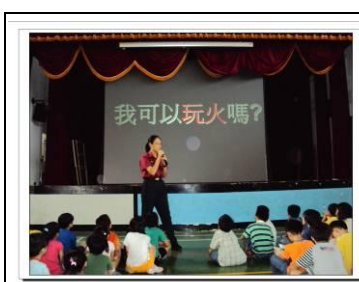
消防隊協助防災宣導

5. 建置完善文教、輔導、消防、學校機構等資源：協助與支援教學活動。例如，與鄰近國中辦理升學輔導講座、大理高中協助春暉宣導等。