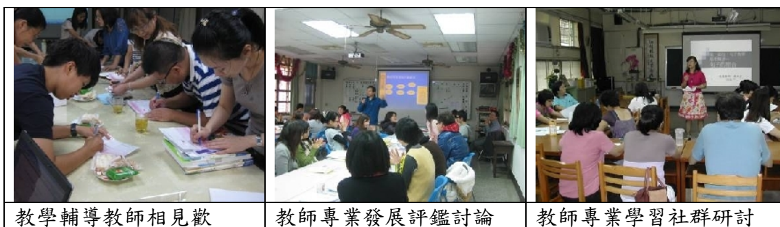
教學輔導教師相見歡