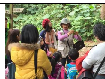
芝山生態綠園導覽