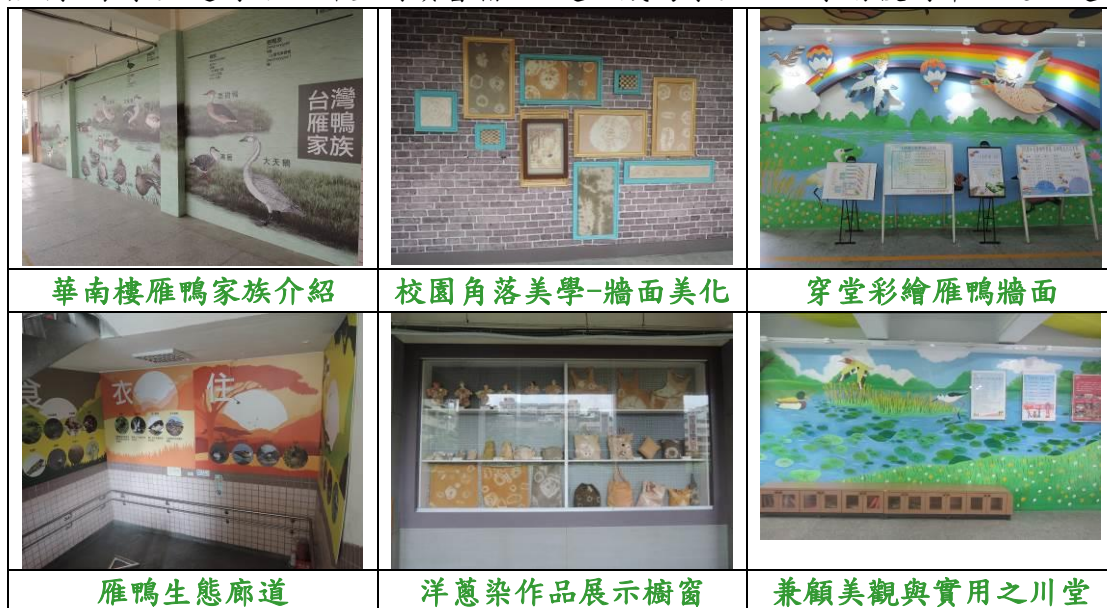
華南樓雁鴨家族介紹

杜威說：「人類塑造環境，環境陶冶人類。」本校校園環境的規劃，以教師教學及學生學習為核心，致力申請經費，規劃校園為真實的教具，讓「環境即是教材，教學利用環境」。工程施作配合學校發展與課程需求，連續兩年申請校園角落美學計畫，建置洋蔥染牆面及雁鴨生態廊道，分別介紹雁鴨知識及洋蔥染課程，並規劃作品展示區，展示學生的學習成果。另申請優質化廊道計畫，將川堂重新整修，結合學校願景及雁鴨課程，設計出繽紛多彩的學習情境，並增設閱讀座椅，讓學生隨時可於川堂閱讀書籍，該處已成為學生上放學前後時常駐足之處。