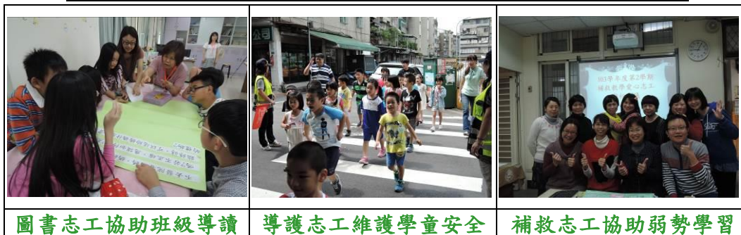
圖書志工協助班級導讀