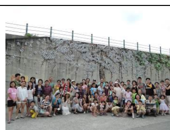
四草綠色隧道探訪