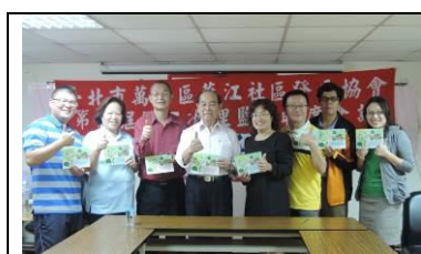
拜訪社區耆老募集資源