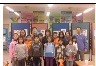
有藝思小團成果發表