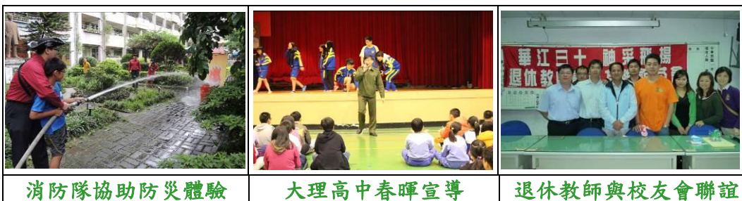
消防隊協助防災體驗

1.5. 建置完善文教、輔導、消防、學校機構等資源：協助與支援教學活動。例如，與鄰近國中辦理升學輔導講座、大理高中協助春暉宣導、消防隊協助防災宣導及消防體驗活動等。