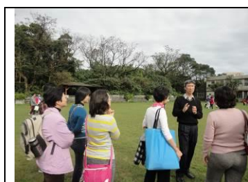
岳明國小標竿學習