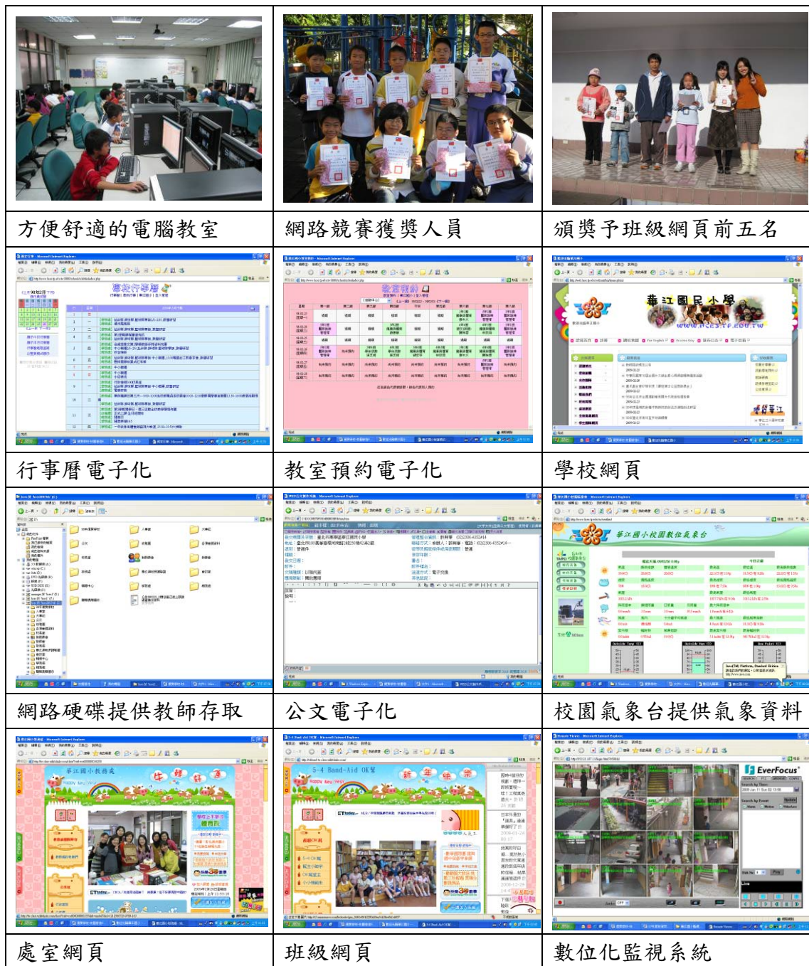
表 6：建置效能卓越的科技校園實施期程