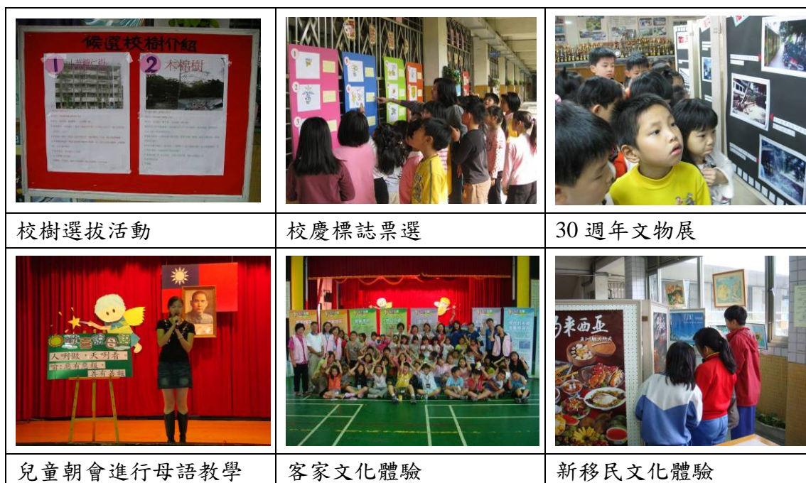
表 3：型塑溫馨和諧的人文校園實施期程