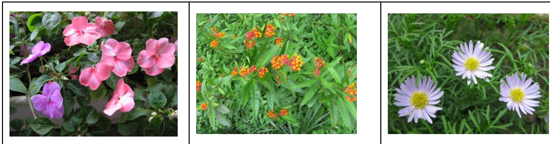
(7) 97 年 9 月與區公所合作，於學校圍牆裝置草花。