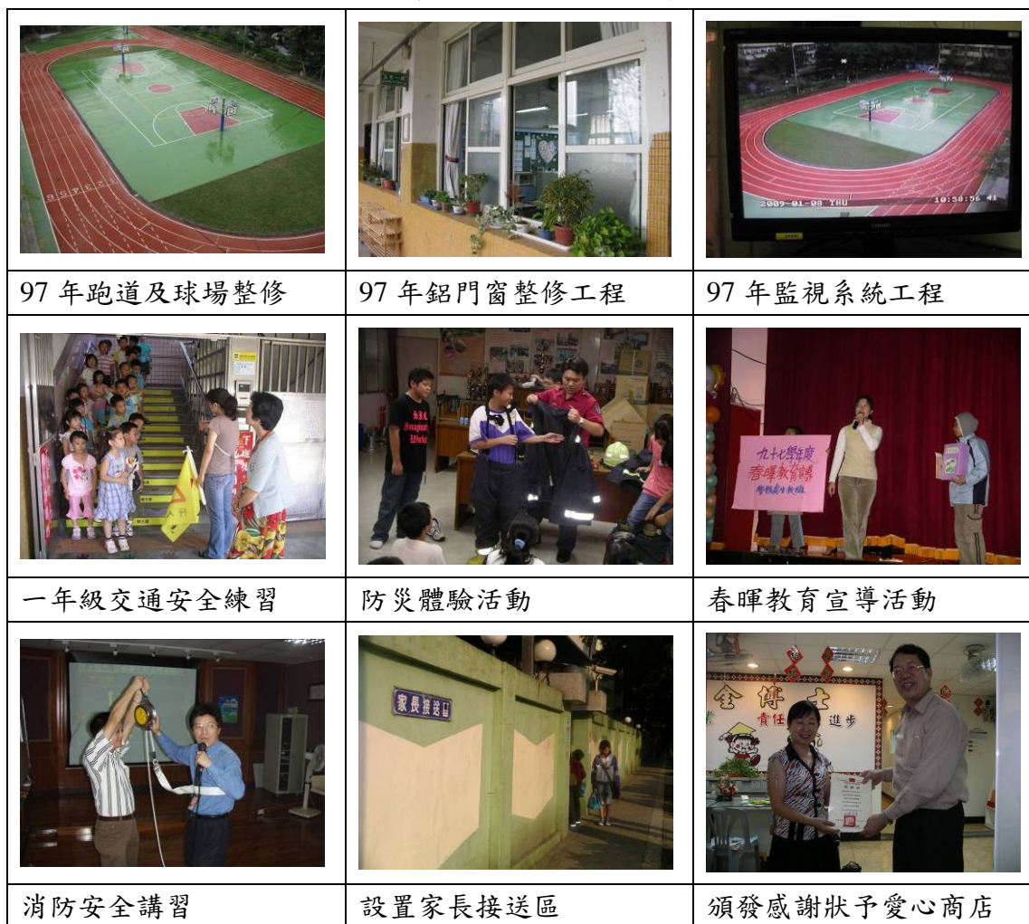
表 3：建立身心無慮的安全校園實施期程